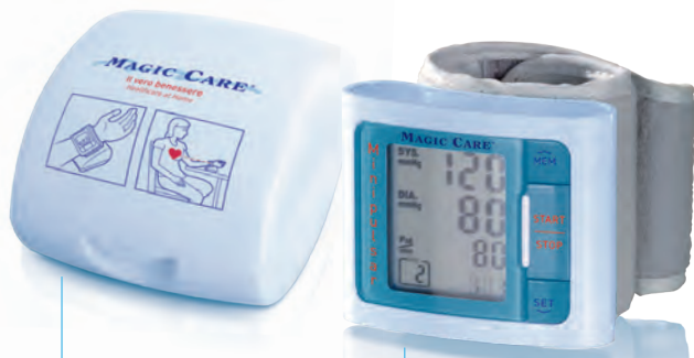
Custodia rigida Rigid Case